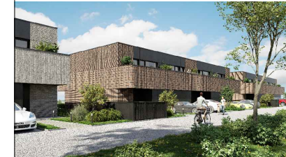
SCHEMAT INWESTYCJI- BUDYNEK B